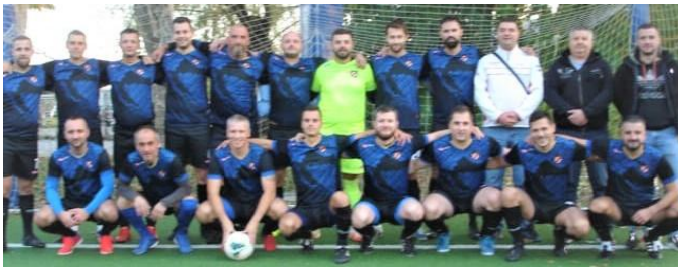
Nogometni klub Hrvatski dragovoljac – veterani (Zagreb)

Zagreb, 25. listopada 2021. godine, igralište Nogometnog kluba Hrvatski dragovoljac